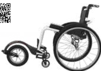
ICON 60 mit TRACK WHEEL