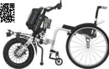
ICON 60 mit PAWS