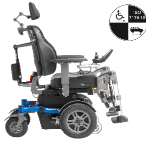
SANGO xx-large FWD Sitzmodul SEGO