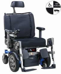
SANGO x-large FWD mit Sitzmodul SEGO Hilfsmittelnummer 18.50.04.5005 Artikelnummer 637021