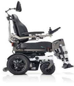
SANGO advanced RWD Sitzmodul SEGO comfort HMV-Nr. 18.50.04.0188