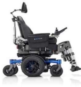
SANGO advanced MWD Sitzmodul SEGO comfort HMV-Nr. 18.50.04.0189