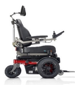
SANGO advanced FWD Sitzmodul SEGO comfort HMV-Nr. 18.50.04.0190