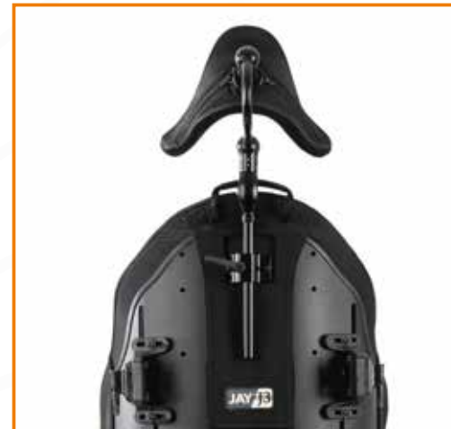
Whitmyer COBRA (abklappbar) mit konturiertem Polster

Die gesamte J3 Produktreihe einschließlich der Kopfstützenhalterungen und -polster wurden nach ISO Standards crash getestet.