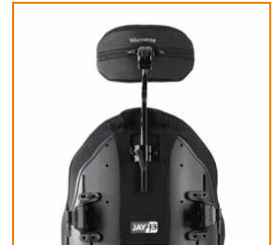
Whitmyer AXYS mit Plush-Pad