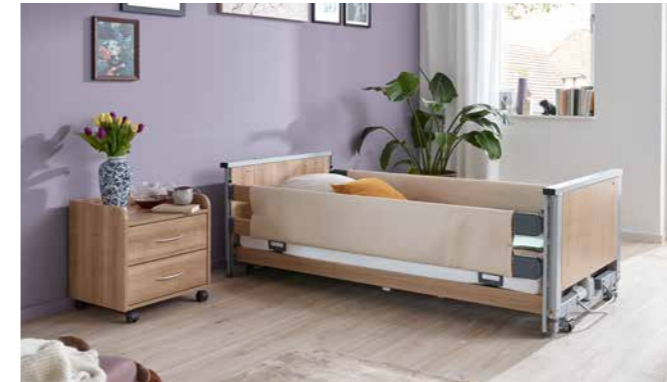
▲ Schaumlederbezüge schützen vor Stößen gegen die Seitensicherungen.