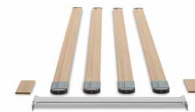
▲ Mit dem Verlängerungs-Set lässt sich die integrierte Bettverlängerung optimal nutzen.

Mit Original-Zubehör von Burmeier wird das Lenus zu einem Bett, das keinen Wunsch offenlässt. Bereits integriert ist eine ausziehbare Verlängerung des Bettrahmens um 20 cm. Zu ihrer Nutzung steht ein Verlängerungs-Set mit einem Ergänzungsstück für die Liegefläche, längeren Seitensicherungsholmen und Füllstücken für die Seitenblenden zur Auswahl. Auch ein passendes Polsterteil zur Verlängerung der Matratze ist erhältlich. Leselampe und Unterbettlicht sorgen für angenehmes Licht und sichere Orientierung bei Nacht. Unruhige Bewohner schützt der Schaumlederbezug vor Stößen gegen die Seitensicherung. Ein praktisches Serviertablett für Mahlzeiten wird einfach auf die Seitensicherung gelegt.