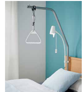
▲ Leselampen lassen sich in die Aufnahmehülse stecken oder am Aufrichter befestigen.