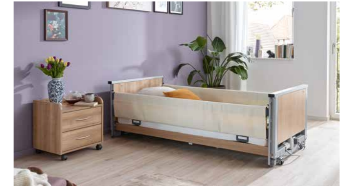
▲ Textile Sofcover verkleiden die Seitensicherung in attraktiven Farben – hier Vanilla.