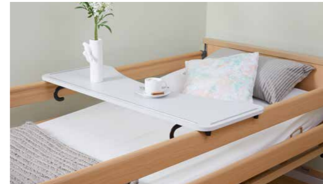
▲ Das praktische Serviertablett für genussvolle Mahlzeiten.