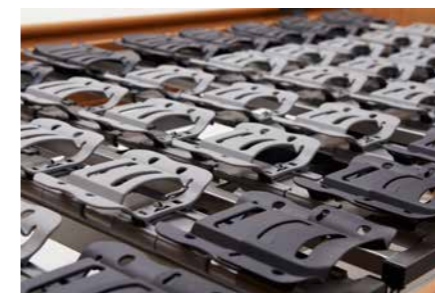
▲ Die Komfortliegefläche sorgt mit 50 freischwingenden Elementen für einen idealen Druckausgleich.