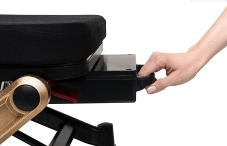
Entnahme des Akkus unter der Sitzfläche